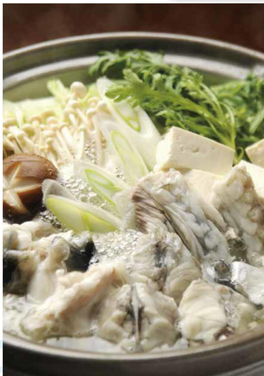
「てっちり」は寒い時期にひときわその存在感を増す