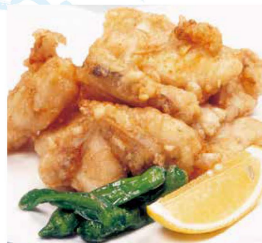
ぷりぷりとした食感のフグのから揚げ