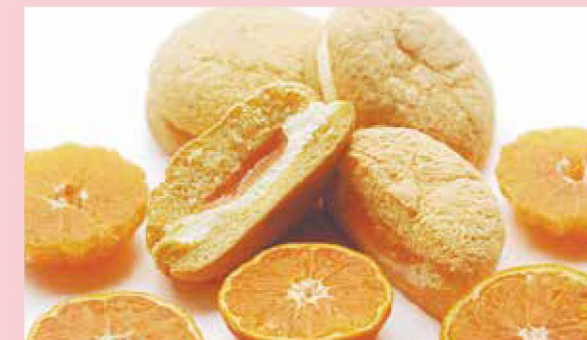
敦賀みかんとコシヒカリの絶妙なハーモニーが特長

国際港・敦賀の歴史を背景に持つ「東浦みかん」を使った、嶺南の洋菓子の始まり処「KOBORI」の「敦賀ふわっせ」。高い技術力で小麦粉未使用を実現し、敦賀産のコシヒカリを使用したカステラに敦賀みかんの甘酸っぱいゼリーをクリームとともに包んだもので、さわやかな味わいが特長である。