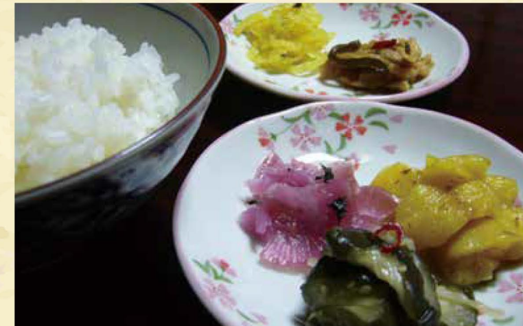
地場産野菜が自慢の「名田庄漬」