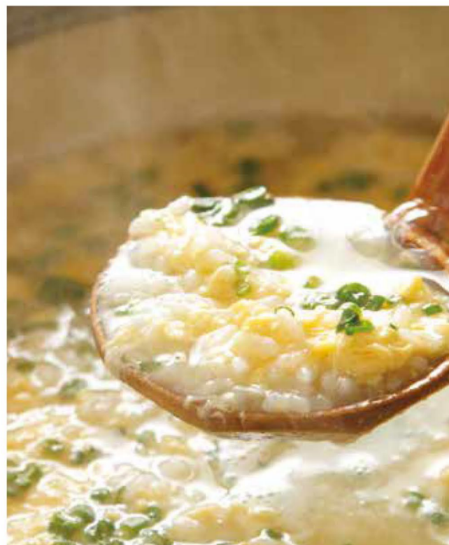
鍋のしめは雑炊で