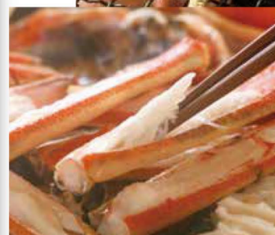
上品な甘みとみずみずしい肉質が人気