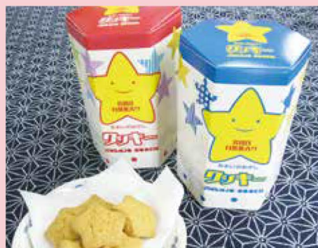
栄養満点のじねんじょを練りこんだクッキー

おおい町名田庄の特産品「自然薯」を使用し、サクサク感が人気の「じねんじょクッキー」。2017年夏、おおい町が暦のふるさとであることにちなみ、星を用いたパッケージに一新。また、クッキーも可愛らしい☆型に。