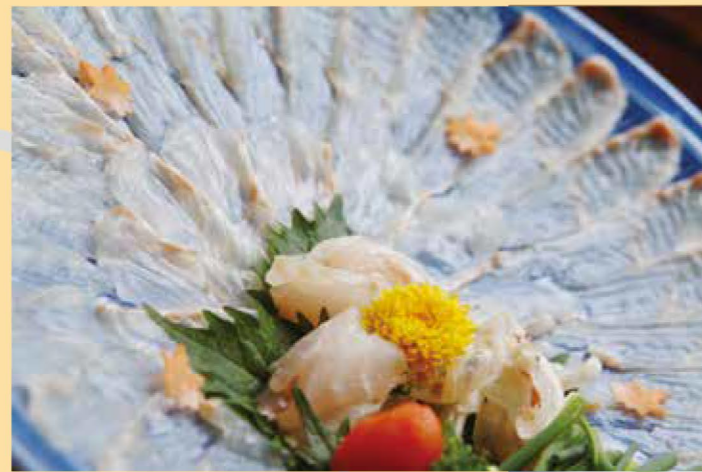
クエの刺身も人気

九州・博多では「アラ」とも呼ばれ、幻の魚とされる「クエ」。10月から3月が旬。大きく、見かけの悪い顔つきからは想像もできない上品な味の白身は、脂がよくのっているのにしつこくない。「一度食べたら、ほかの魚はクエん」といわれるほどの高級魚。刺身や焼いてもおいしいが、何といても「鍋」が最高といわれている。その白身は上質なトロのような甘みを醸し、身と皮の間のゼラチン質は天然のコラーゲンがたっぷり、女性にはうれしかぎり。若狭町ではこの時期にクエ料理を提供しており、食通をうならせるほどの絶品と評判だ。極上の味をぜひとも味わってみては。