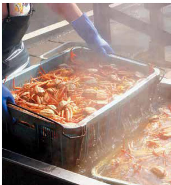
カニを茹でる風景は冬の風物詩