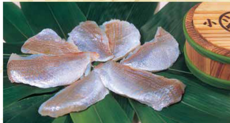
贈答用としても人気