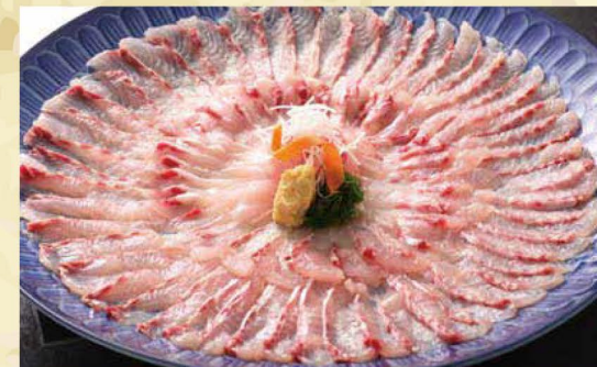
コイ・フナ ショウガ醤油や酢みそを付けて食べるコイの刺身

穏やかな海と緑豊かな山。そして、千年以上前からの都と交流があった「御食国」若狭。その風土と歴史から、この地ならではの食材や料理が数多く育まれていった。食材の宝庫・若狭から全国各地へ届けられる海や山の幸およびその特産品は、「若狭もん」というブランドで昔も今も重宝される。「若狭もん」の幾つかを紹介する。