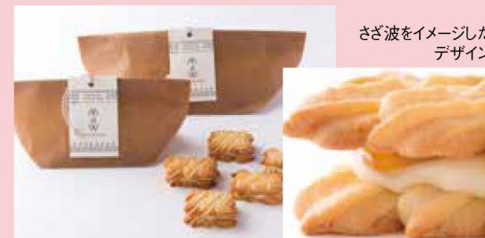
さざ波をイメージしたデザイン

若狭町の地元民宿の女将さんが2017年創作した、ご当地スイーツ「さとうみのさざなみ」。三方五湖と若狭湾のさざ波をイメージした「ナミナミ」模様、の生地には若狭名産の福井梅を使ったコンフィチュールをサンドした極上クッキーである。ミルクレープなホワイトチョコが梅のほよい酸味を引き立て、リキュールのリッチな風味と相まってもっと食べたくなるおいしさ。