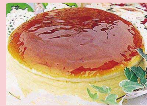
新鮮な牛乳を使用し、さっぱり味が持ち味