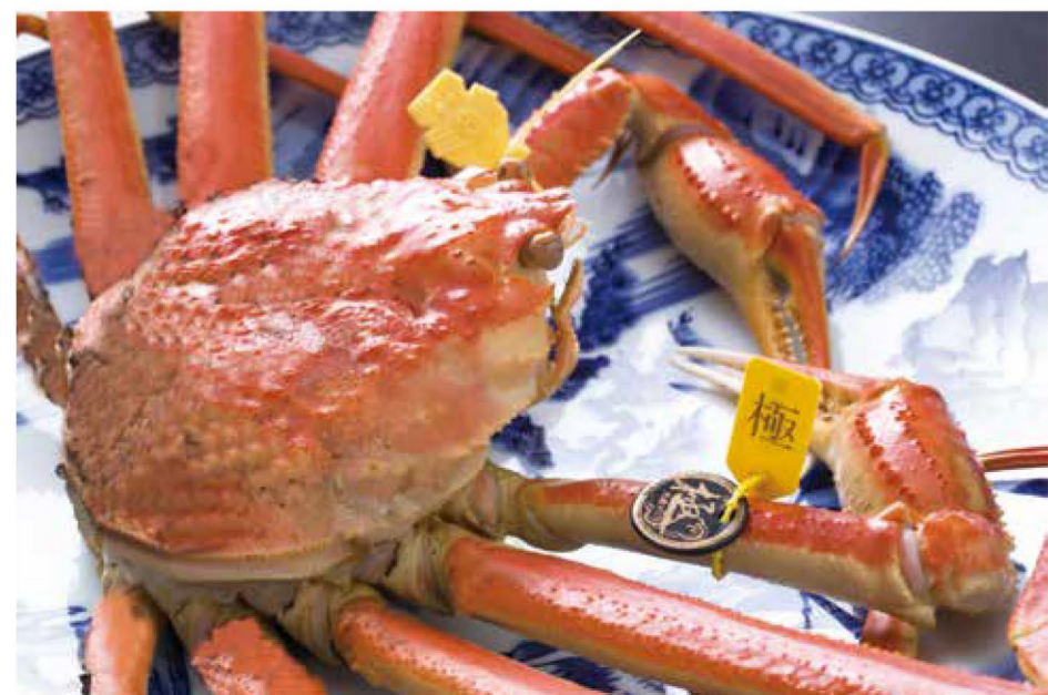
最高級ブランドの「極」