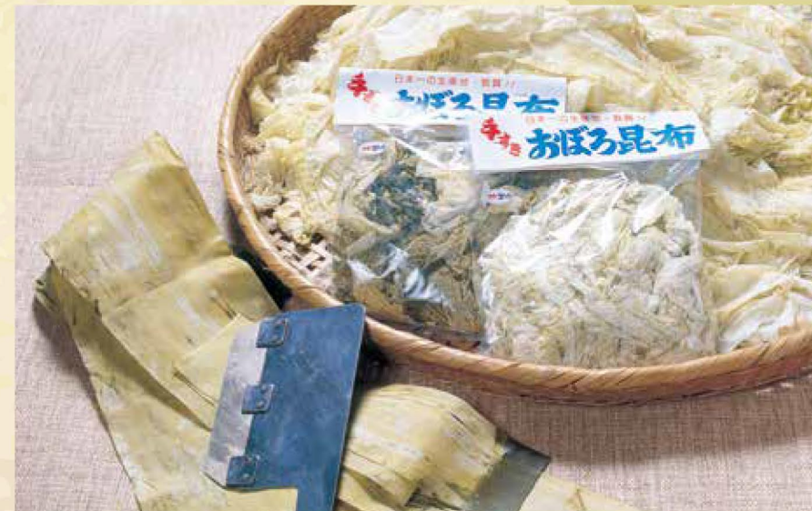
口に入れるとほのかに潮の香りが広がる、敦賀産の「おぼろ昆布」

若狭湾の古くからの海産物の代表格はサバ。水揚げされたサバは「鯖街道」の起点・小浜市から熊川宿(若狭町)などを経由して京都に運ばれた。ただ、サバは身持ちが悪いため焼いたりしめたりと保存に努め、そこから生まれたのが「鯖ずし」である。長方形に固めた酢飯に塩サバの半身をのせ、出汁昆布で全体を包んだ棒寿司をいう。鯖街道沿いには「鯖ずし」を扱う料理店が数多くあり、また、伝統的な「鯖ずし」のほか、最近、注目を集めているのは「焼き鯖寿司」。脂ののった新鮮なサバを焼き、寿司にしたもので、熱を加えたサバは余分な脂が落とされ、生臭さが消え、うま味も倍増する。後味さっぱりで、寿司飯との相性も抜群。