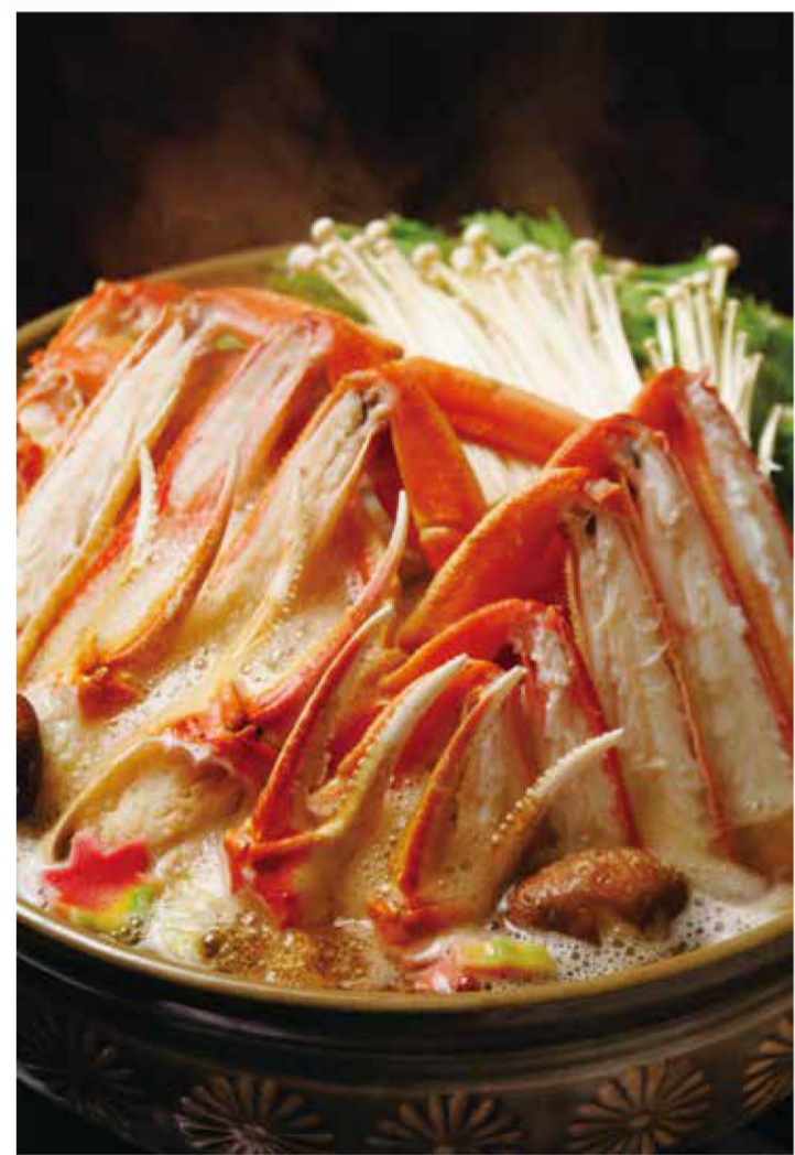
カニ全体のエキスがスープに溶け出す「カニすき」