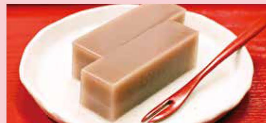
冬に食べるのが福井スタイル