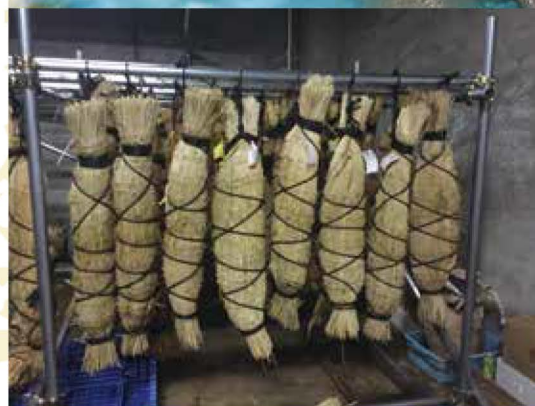
「塩ぶり」のコモ巻き

大本山永平寺御用達の漬け物の「名田庄漬」。豊かな自然に囲まれた、寒暖の差が激しい山村「名田庄」の気候、風土で地元の農家が丹精込めて育てたおいしい野菜を、合成保存料なしで半年間じっくりと漬け込んである。キュウリ、ナス、ショウガが入った醤油漬けでごまの風味と唐辛子がピリッときた「ふる里」、ダイコンを刻んだ「しそ風味」など様々な味がある。温かいご飯、お茶漬け、お酒のつまみに昔ながらの「名田庄漬」を添えて素材の風味と食感を楽しんでみては。