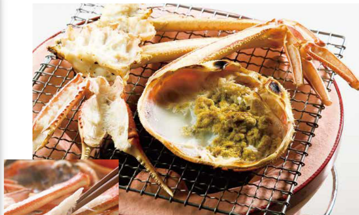
濃厚な味わいのカニ味噌