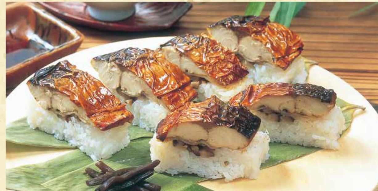
最近、人気を呼んでいる「焼き鯖寿司」

三方湖の冬の風物詩・たたき網漁。水温が低下して動きが鈍くなった湖底のコイやフナを小舟から竹ざおで湖面をたたいて驚かせ、仕掛けた刺し網に追いつくまで伝統漁法だ。コイ・フナ料理の旬は脂がのる冬で、地元の若狭町ではごちそうとして食膳に上る。コイは冬の寒さで身が締まっており、刺身で食べるほか、甘露煮や味噌汁にもする。また、フナの刺身の味わいは淡泊で、噛むと甘みがじんわりし、臭みもなく美味この上ない。