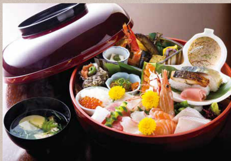
約130種類のメニューがそろ