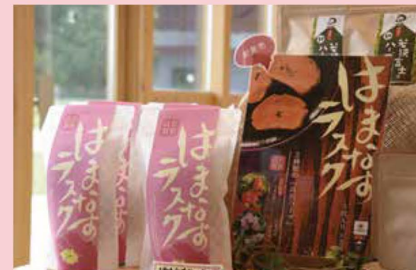
高浜特産のはまなすの実を使用

2017年10月より発売スタート。高浜町花「はまなす」の実のペーストを贅沢に塗り込み、青葉山で採れた和のハーブ「イブキジャコウソウ(列名:百里香)」を添えた「The 高浜」ともいえる新名物である。