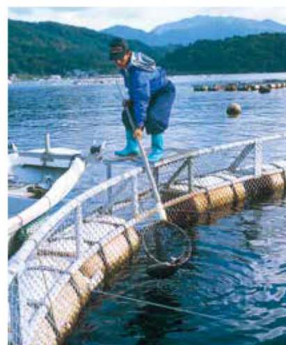
若狭湾の養殖風景