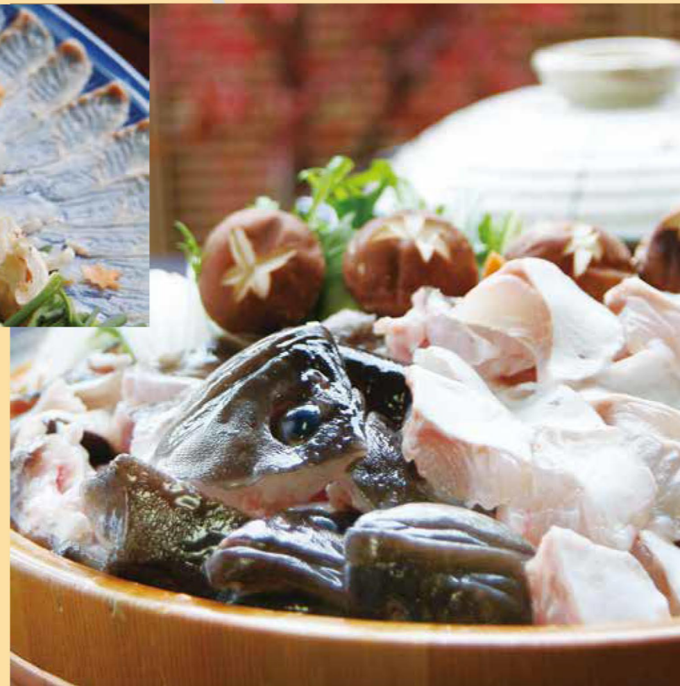
食通をうならせる「クエ鍋」