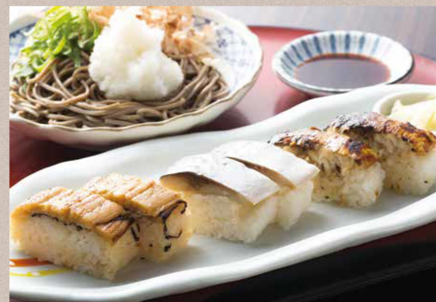
海、里・山の幸が満載