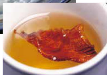
香ばしさとフグのうま味を味わえる「ヒレ酒」