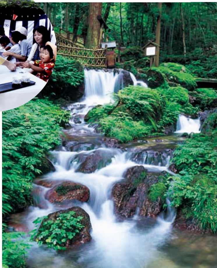
清らかな水の流れて涼しく暑さを忘れられる