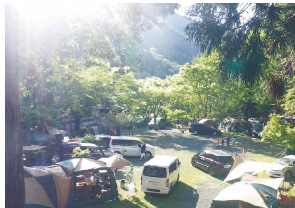
アウトドア施設が充実し、様々な体験メニューも利用できる