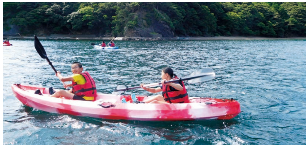
シーカヤックは、初心者も安心して楽しめる