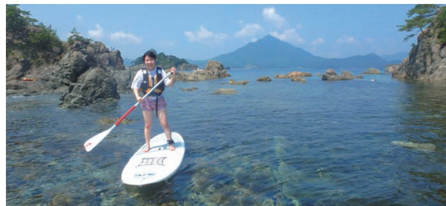
SUPは、楽しいコースが盛りだくさん