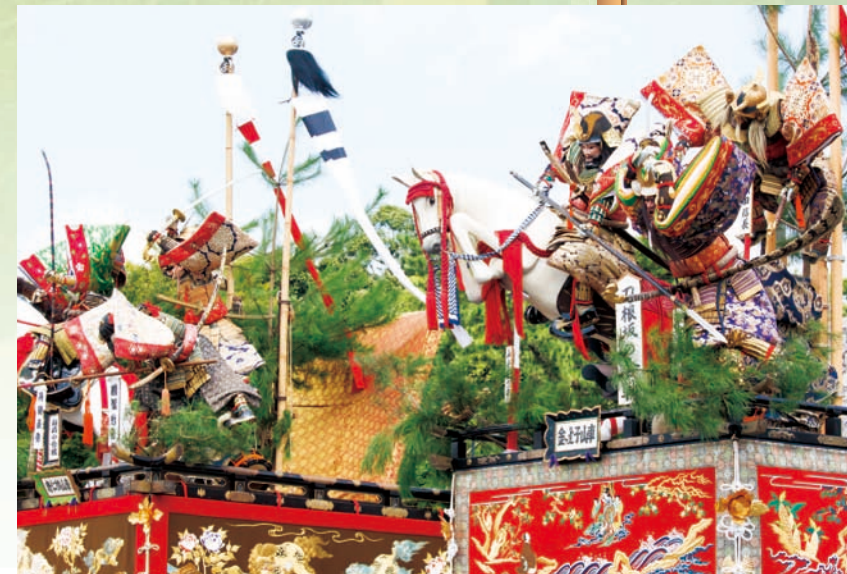
豪華絢爛な六基の山車。氣比神宮前に集結のあと、勇壮に市内を練り歩く