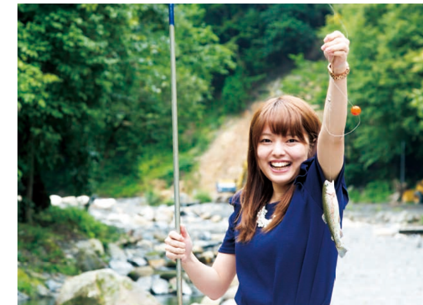
自然渓流釣り場が人気