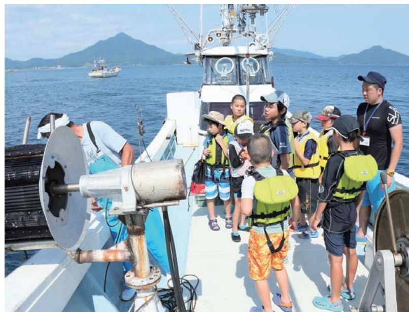
サマーキャンプでは日常生活にはない感動体験が用意されている